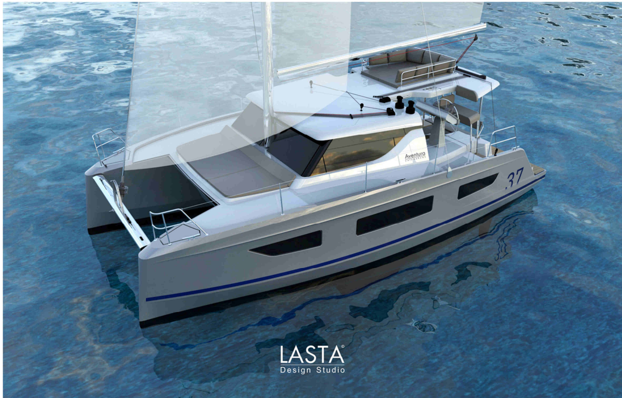
AVENTURA 37 Weltpremiere im Juni 2021 mit cat sale