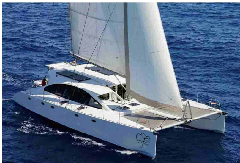
Dudley Dix DH 550 N°1 Bj.2016 € 695.000,-- 4sale at cat sale

All unsere Angebote Hochsee-tauglicher sofort verfügbarer Multihulls finden Sie unter: