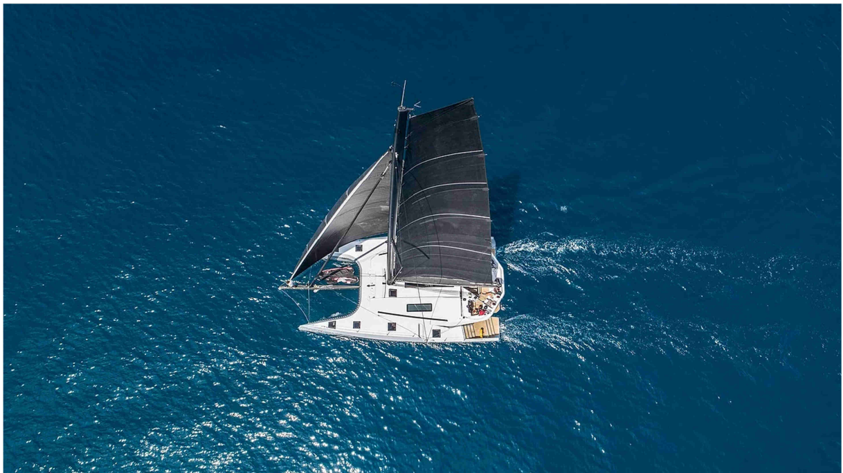
McConnaghy 52 bei ersten Segeltests auf dem Mittelmeer mit cat sale