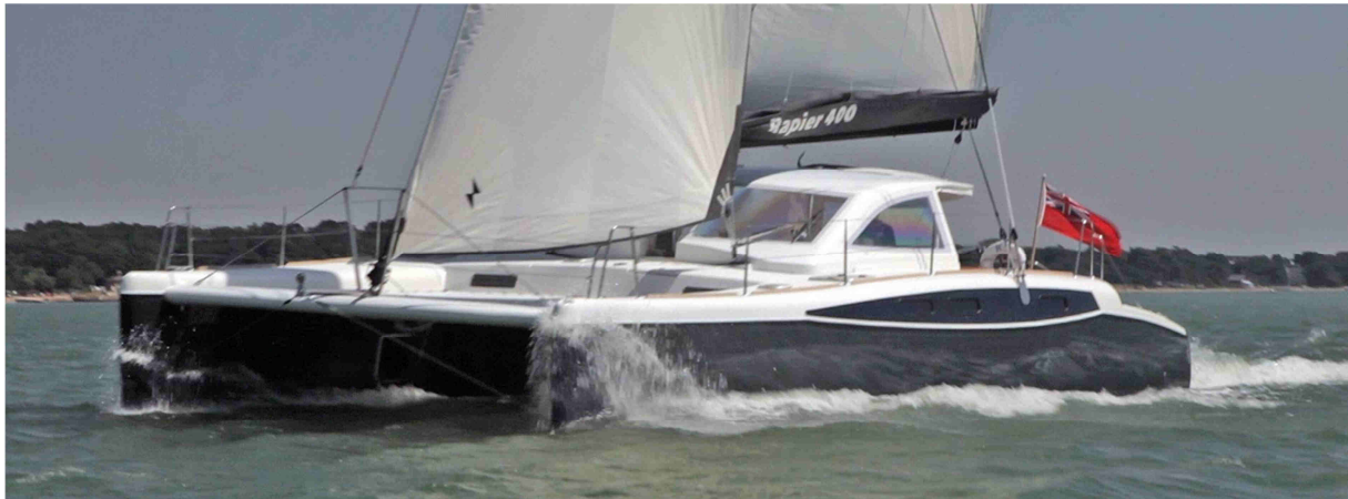
RAPIER 400 Performance Line von Broadblue, ein offenes Konzept

Der von Darren Newton mit dem Design Büro Dazcat konzipierte Fahrtenkat Broadblue 346 wird in Stettin / Polen gebaut und vereint modernes Design mit englischem Stil und fundierten polnischen Bootsbau. Bei nur 10,2m Schiffslänge bietet der Kat hervorragende Segelleistungen. Ausgelegt für maximal sechs Personen in zwei Doppelkabinen achtern und zwei Einzelkabinen in den Bugräumen erweist sich der Innenraum als äußerst voluminös und komfortabel auch auf längeren Seetörns. A zertifiziert für Hochseesegeln bei mehr als 8m Wellenhöhe, als auch, aufgrund der kompakten Breite, für Binnenreviere und Schleusenpassagen geeignet, bietet dieser Katamaran ein gewaltiges Nutzungspotential.