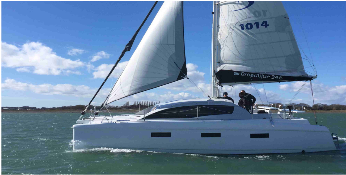
Broadblue 346 vorgestellt auf der LGM Multihull-Show mit cat sale

Der von Darren Newton mit dem Design Büro Dazcat konzipierte Fahrtenkat Broadblue 346 wird in Stettin / Polen gebaut und vereint modernes Design mit englischem Stil und fundierten polnischen Bootsbau. Bei nur 10,2m Schiffslänge bietet der Kat hervorragende Segelleistungen. Ausgelegt für maximal sechs Personen in zwei Doppelkabinen achtern und zwei Einzelkabinen in den Bugräumen erweist sich der Innenraum als äußerst voluminös und komfortabel auch auf längeren Seetörns. A zertifiziert für Hochseesegeln bei mehr als 8m Wellenhöhe, als auch, aufgrund der kompakten Breite, für Binnenreviere und Schleusenpassagen geeignet, bietet dieser Katamaran ein gewaltiges Nutzungspotential.