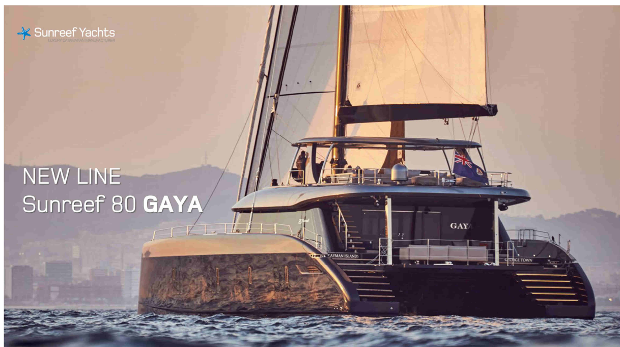
NEW Sunreef ECO-Line für den gediegenen Komfort auf Langfahrt ab sofort 4sale bei cat sale

Nach drei Jahrzehnten als Multihull Broker und Werftvertretung bietet cat sale eine exzellente Auswahl der besten Eigner orientierten Performance Multihulls für Langfahrt. Wir beraten Sie persönlich und umfassend auf Ihrem Weg an Bord. Mit Erfahrung und Engagement helfen wir, die Ihren Ansprüchen entsprechende Hochseetüchtige Yacht, für ein sicheres Bordleben auf den Ozeanen zu finden und gemäß Ihren Wünschen im Detail zu definieren. Vertrauensvoll vernetzt mit den Seglern, Werften, Designern und Konstrukteuren der Multihulls arbeiten wir mit Leidenschaft für Sie.