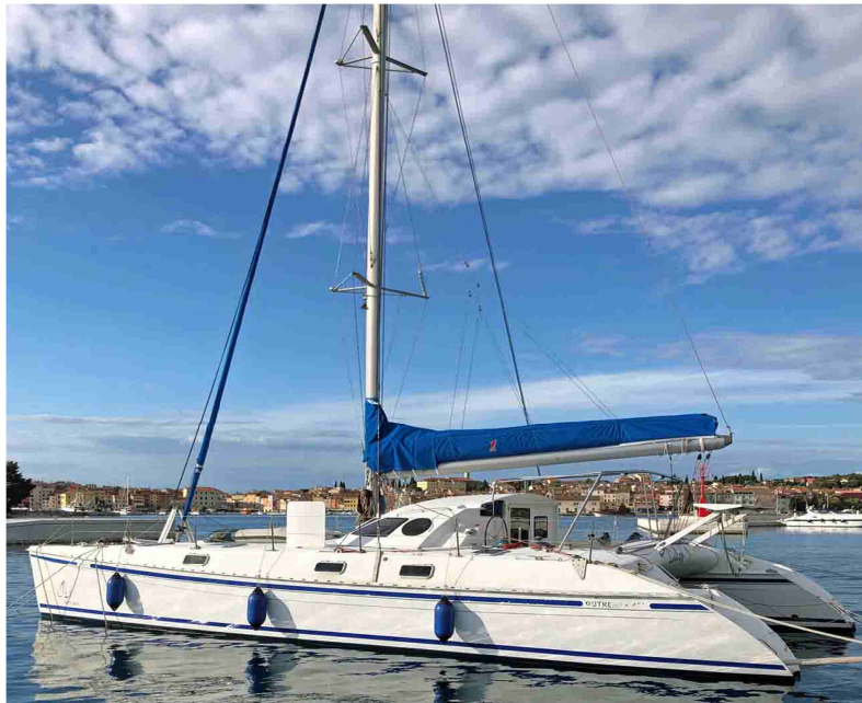
OUTREMER 45 N°15 Bj.2002 € 275.000,-- 4sale at cat sale